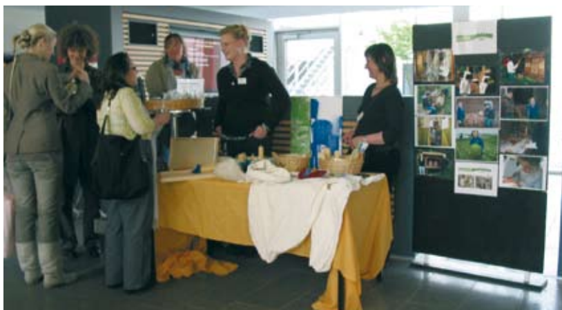
Fachtagung „Bildung coachen“. Stand der Jugendwerkstatt

Persönliches und soziales Lernen bilden auch 2009 einen Eckpfeiler der täglichen Arbeit in der Jugendwerkstatt. Mit Aktionen, wie Bildungsfahrten, themenbezogene Projekte u.a. verfolgen wir unter anderem die Ziele, die soziale Interaktionsfähigkeit der Jugendlichen zu verbessern, sowie das Interesse an neuen Berufsfeldern zu wecken, die Allgemeinbildung zu fördern und das Gruppengefühl in entspannter Atmosphäre zu stärken.