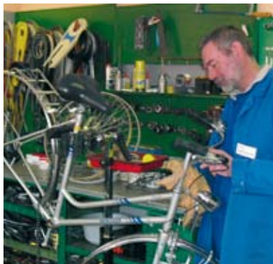
AGH-Kraft beim Reinigen eines Kundenfahrrads in der Radstation

In manchen Fällen liegen auch Mehrfachproblematiken vor. Die geringen Qualifikationen sind jedoch die am häufigsten vorkommenden Vermittlungshemmnisse, die eine Arbeitsaufnahme auf dem ersten Arbeitsmarkt erschweren.