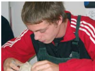
Ein Teilnehmer der Schülerwerkstatt erstellt Skulptur aus Ton

Die Schülerwerkstatt bietet auch im Jahr 2009 Jugendlichen die Möglichkeit, ihre Schulpflicht an einem außerschulischen Lernort zu erfüllen. Die Tagesstruktur entspricht im Wesentlichen der Jugendwerkstatt. Die Jugendlichen werden weiterhin innerhalb der Jugendwerkstatt und in Kooperation mit dem Berufskolleg in Werne beschult. Die Schüler und Schülerinnen arbeiten in den angebotenen Fachbereichen mit, um ihre zumeist eher handlungsorientierte Lernfähigkeit zu unterstützen und sich beruflich zu orientieren.